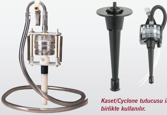
Kaset/Cyclone tutucusu ile birlikte kullanılır.