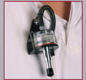
Kaset ve tutucu ile birlikte